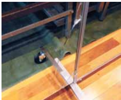
▲ 割れてしまったガラス製ミラー

安全性と丈夫さにこだわって、ステンレス複合ミラーを使用。ガラス製のように割れないので安心です。