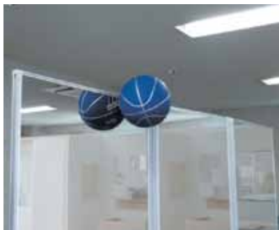
▲ ボールがぶつかっても倒れません

たとえバスケットボールがぶつかっても倒れない、しっかりした脚部を採用。タフな設計です。